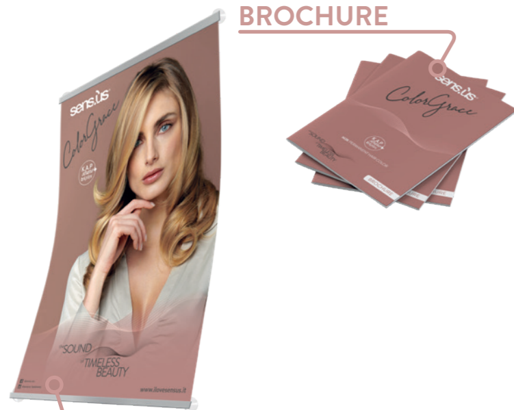
STOFFEN BANNER 60X90